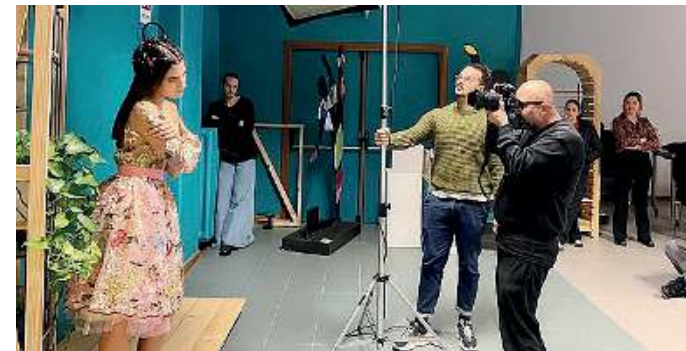
Un'esperienza preziosa. Lo shooting col noto fotografo Armando Grillo