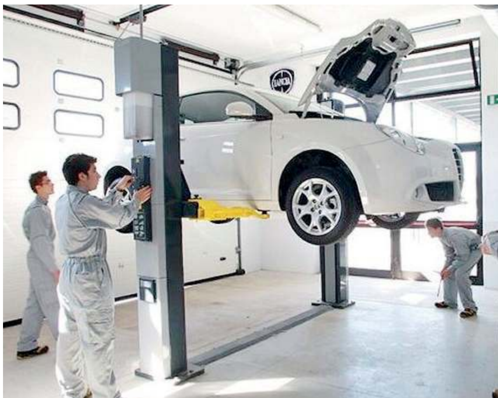
Alla prova. Nei laboratori gli allievi si dedicano a molta attività pratica