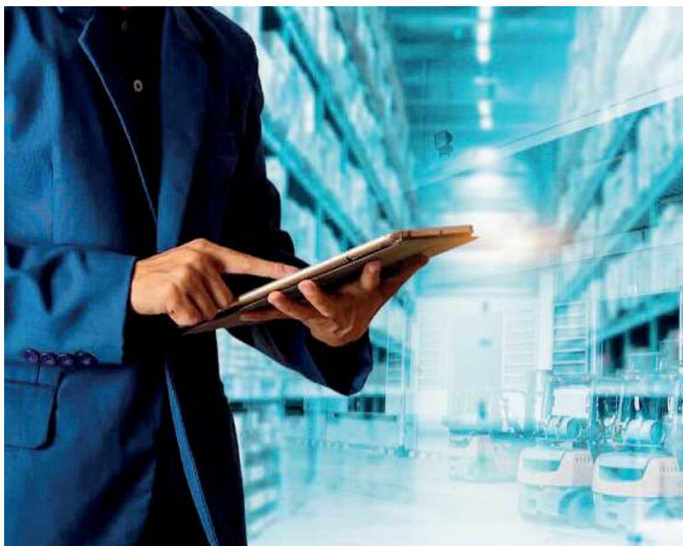
Per tutti. Il corso «Operatore dei sistemi e servizi logistici» di Ial Brescia ha anche una versione personalizzata