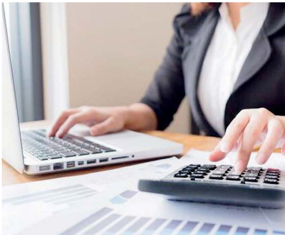
Molti sbocchi. Dall'amministrazione, finanza e marketing al turismo