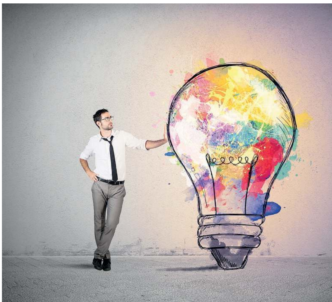
Emergenti. Nuove figure popoleranno il futuro mondo del lavoro

Accanto alle professioni strettamente tecnologiche, vi è un'altra area in forte espansione: quella delle professioni creative. Il lavoro creativo è altrettanto impegnativo e richiede competenze specifiche e capacità di adattamento. Ruoli come designer grafico, illustratore, fumettista e direttore creativo, che operano nel campo del design, della moda, della scrittura e della comunicazione, sono fondamentali per la società moderna e sono diventati sempre più richiesti grazie all'espansione dei media digitali e dei social network. Questi professionisti devono continuamente aggiornare le proprie competenze per restare al passo con le tendenze e le tecnologie emergenti, e spesso lavorano in team multidisciplinari, affrontando sfide creative e risolvendo problemi in modo innovativo. //