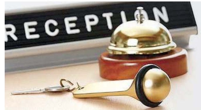
Gli indirizzi. L'Istituto propone anche il Turistico