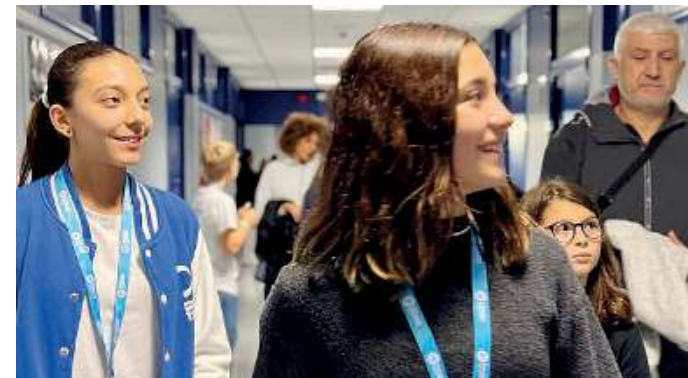
Col sorriso. Studenti dei Salesiani