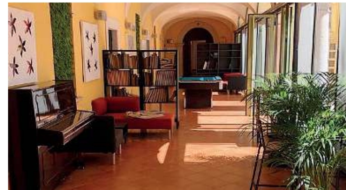
Alle porte della Franciacorta. Villa Pace, sede della scuola